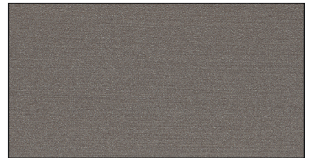
graphitgrau ▪ graphite grey Art.-No. 7723