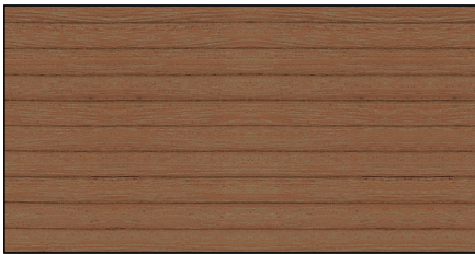
bangkirai intensiv ▪ bangkirai intensive Art.-No. 7690