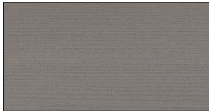
silbergrau ▪ patina grey Art.-No. 7696