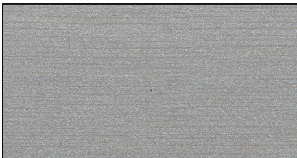
platingrau ▪ platinum grey Art.-No. 7724