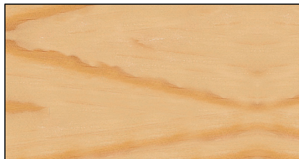
farblos ▪ clear Art.-No. 7694