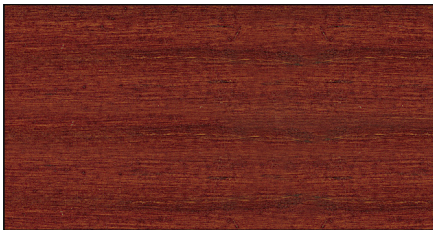
teak intensiv ▪ teak intensive Art.-No. 7693