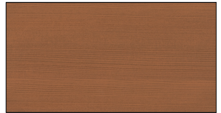
lärche intensiv ▪ larch intensive Art.-No. 7692